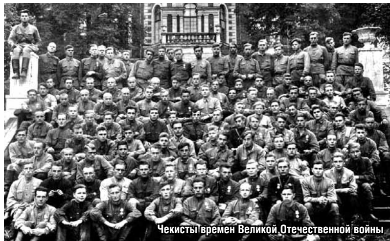
Чекисты времен Великой Отечественной войны

Со временем кадровый аппарат органов безопасности расширялся, улучшалось его материально-техническое оснащение, повышалась квалификация