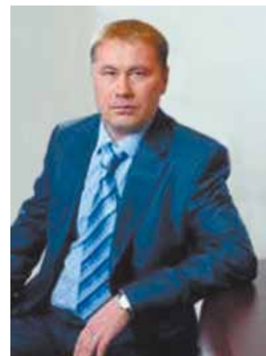
Поздравляю всех с наступающим 2014 годом! Удачи, здоровья, успехов!

стороны, земля есть земля, и она всегда имеет цену. В общем, вопросов больше чем ответов. Поэтому хотелось бы жителям пожелать активнее участвовать в процессе межевания. Определить и добиться включения в проект межевания оптимально подходящих для вашего дома границ максимального земельного участка. И прежде чем впоследствии идти оформлять участки в собственность, тщательно просчитать все расходы и выгоды, и исходя из этого, определить площадь и границы земельного участка. А представителей государственной власти хотелось бы попросить слушать и слышать жителей. Тогда такой важнейший вопрос как земля не станет источником социальной напряженности.